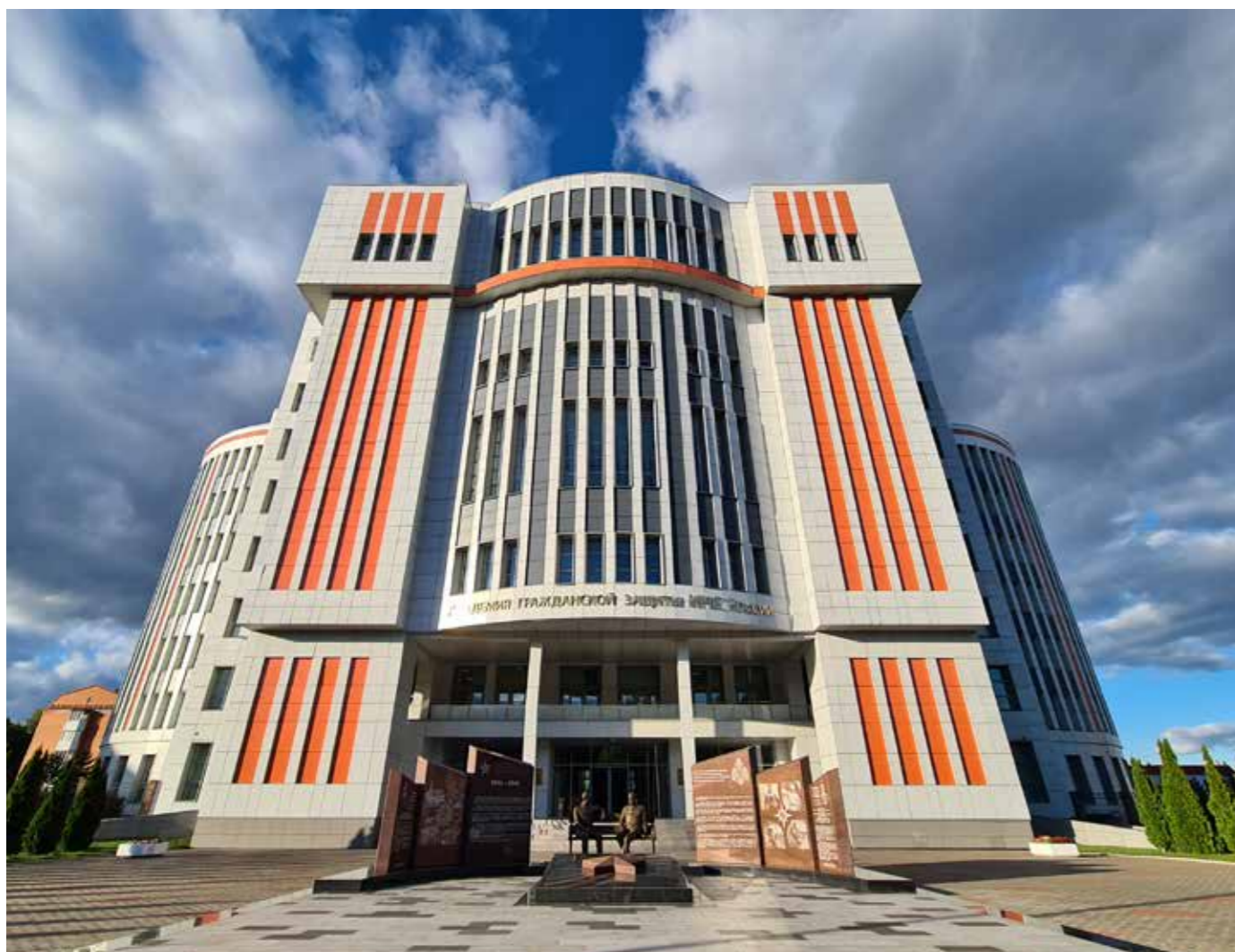
Направления подготовки высшего образования за счет средств федерального бюджета и на базе среднего общего и среднего профессионального образования (очная форма обучения, квалификация «бакалавр» – курсанты)